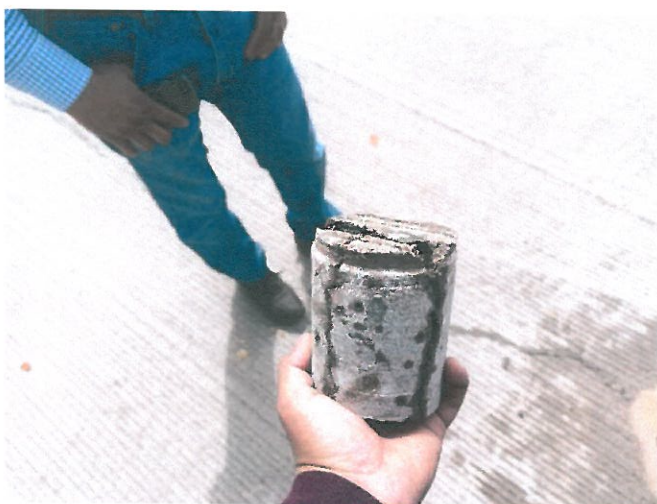
CALLE SIN NOMBRE